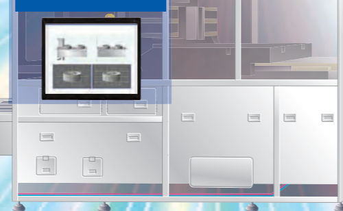
案例 2 应用程序PC