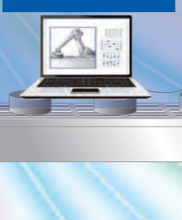
案例 3 维护PC