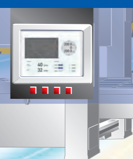
案例 1 高性能人机界面